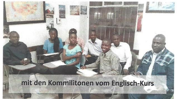
mit den Kommilitonen vom Englisch-Kurs

Avenue Col. Monjila Complexe UteXafrica Ngaliema, Kinshasa, RDC