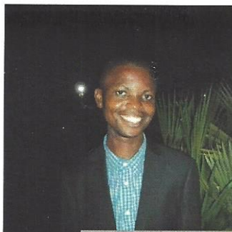
ein neueres Bild aus Kinshasa